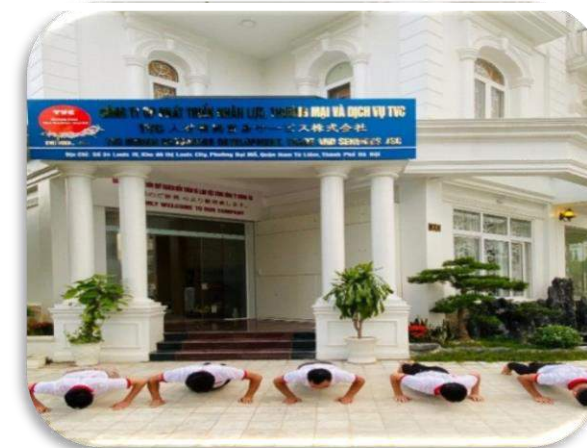
Kiểm tra thể lực (hít đất)