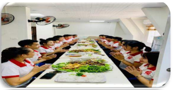
Quang cảnh nhà ăn tại trung tâm TVC