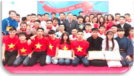
Hội diễn thuyết tại công ty TVC