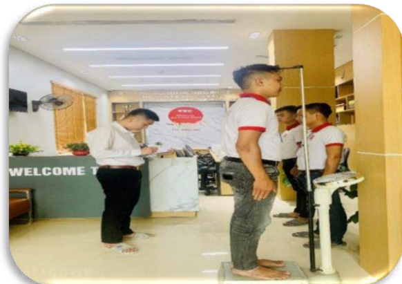
Kiểm tra cơ thể (cân nặng, chiều cao)