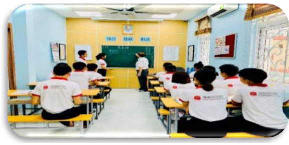
Học tiếng Nhật cùng giáo viên người Nhật