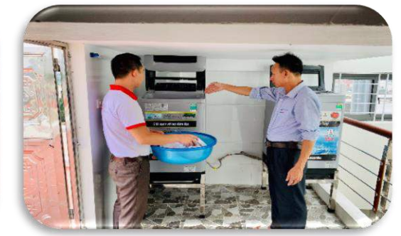
Hướng dẫn sử dụng máy giặt