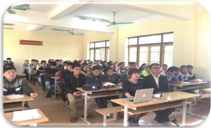
Hội thảo giải thích chế độ TTS của công ty TVC tại các địa phương ở Việt Nam

Đội ngũ nhân viên tuyển dụng nhân lực của chúng tôi đóng quân trên khắp Việt Nam, phụ trách tuyển dụng những nhân lực ưu tú mỗi ngày. Để đáp ứng với nhu cầu của khách hàng chúng tôi luôn tìm kiếm những nhân lực có trình độ học vấn tốt, hiểu được cách làm, suy nghĩ của người Nhật, bằng cách đào tạo liên tục và luôn cố gắng đạt được các kỹ năng đó. Chúng tôi luôn tìm kiếm những ứng viên trẻ, khỏe, luôn có ý chí trong công việc, có tác phong thái độ tốt. Để bảo đảm chất lượng của thực tập sinh phù hợp với yêu cầu của quý khách hàng, chúng tôi luôn tiến hành tuyển chọn ứng viên một cách nghiêm ngặt.