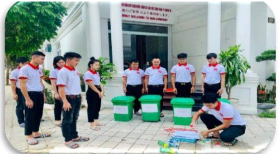
Luyện tập phân loại rác