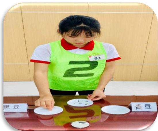
Kiểm tra sự khéo léo, nhanh nhẹn