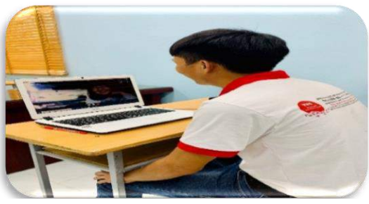
Nghiệp đoàn quản lý kiểm tra hội thoại tiếng Nhật