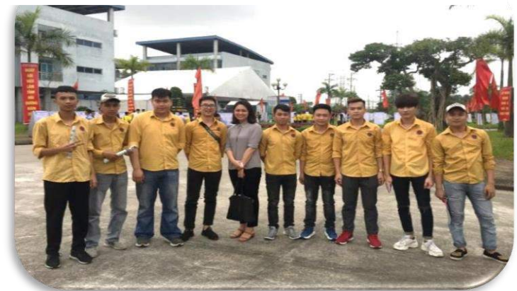
Tuyển dụng nhân lực ở các trường nghề