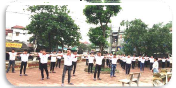
Tập thể dục buổi sáng theo bài của Nhật Bản