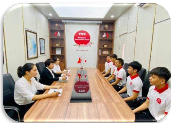
Phòng vấn sơ tuyển ứng viên

SAU KHI NHẬN ĐƯỢC PHIẾU TUYỂN DỤNG TỪ QUÝ NGHIỆP ĐOÀN QUẢN LÝ, CÔNG TY TVC SẼ TIẾN HÀNH SƠ TUYỂN TRƯỚC ỨNG VIÊN, SAU ĐÓ CHỈ ỨNG VIÊN ĐỒ SẼ ĐƯỢC GIỚI THIỆU TRỞ THÀNH ỨNG VIÊN PHÒNG VẤN CỦA CÁC XÍ NGHIỆP