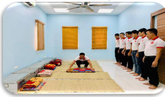
Huấn luyện cuộc sống tập thể Gọn gàng – Sạch sẽ