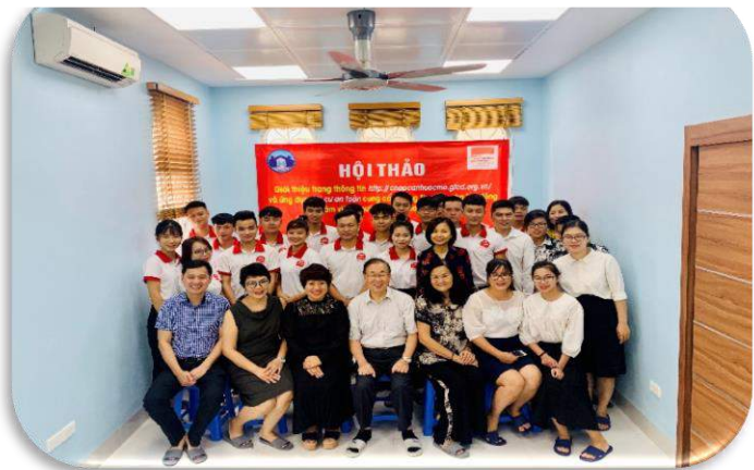
Hội thảo tại trung tâm TVC