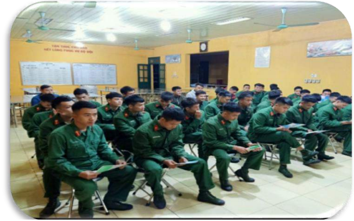
Hội thảo giải thích chế độ TTS của công ty TVC tại các doanh trại quân ngũ