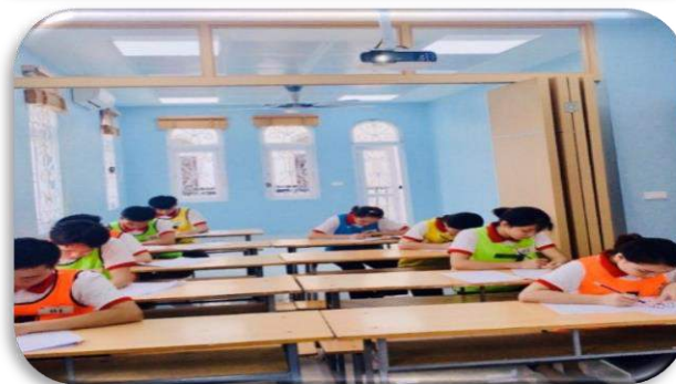
Kiểm tra trình độ tiếp thu nhận thức (Test IQ)