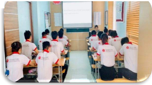
Giáo dục định hướng