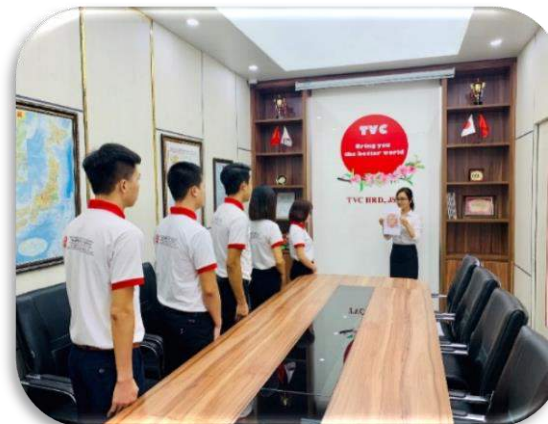
Kiểm tra mù màu