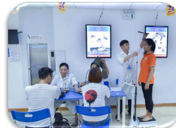
Khám sức khỏe tại bệnh viện do công ty TVC chỉ định